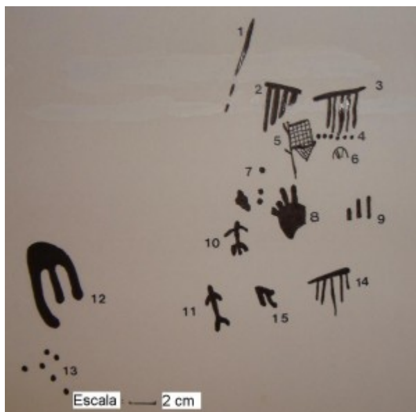
Lámina V.- Risquillo de Paulino, Berzocana (Cáceres).

Para visitar este conjunto se puede partir de la población de Cañamero tomando la carretera que va a Berzocana. Poco antes de llegar al cruce de Solana - como un par de Km. - , hay a mano izquierda unas buena explanada; dejad aquí el vehículo y ascended por la parte opuesta hasta los primeros crestones que emergen a mitad de la ladera. Si queréis eludir las jaras debéis ascender más bien hacia la derecha; han de bastar 15 o 20 minutos.