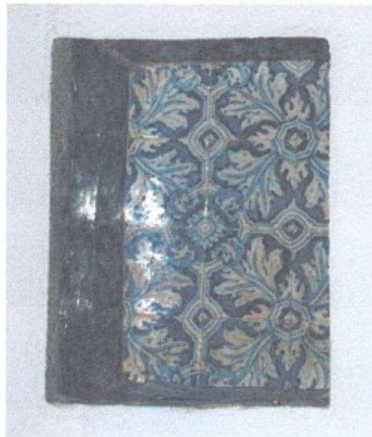
Lám. 7. Nicho situado junto al panel de la Anunciación (Foto: Autor).

La Anunciación es uno de los temas más habituales dentro de la iconografía cristiana del arte occidental, especialmente a partir del periodo Gótico y del Renacimiento, momento en que cobra especial relevancia el tema mariano. Por “Anunciación” se entiende la visita del Arcángel Gabriel, enviado por Dios, a la Virgen María para pedirle que sea la Madre de Dios por la gracia del Espíritu Santo. Se relaciona a su vez con la Encarnación porque gracias a esta visita, como lo que hasta entonces era palabra, el Verbo, ahora se convierte en el ser de carne y hueso que será Cristo.