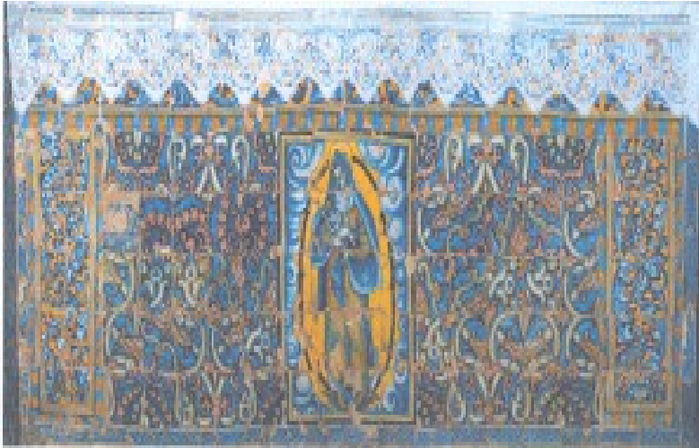
Lám. 3. Frontal de altar de la Virgen del Rosario (Foto: Autor).

La imagen de la Virgen del Rosario ocupa el centro del frontal, y está compuesto por 20 azulejos que ocupan una superficie de 70 x 55 cm. El marco está formado por tres bandas: azul, amarillo y blanco. A continuación, unas nubes con formas de volutas enmarcan un óvalo hecho con cuentas de rosario con rosetas alternantes que a su vez, aloja la imagen de la Virgen con el Niño en brazos sobre un creciente lunar y la cabeza de un serafín. La iconografía está inspirada en las abundantes imágenes esculpidas, talladas o pintadas de finales del siglo XVI y principios del XVII.