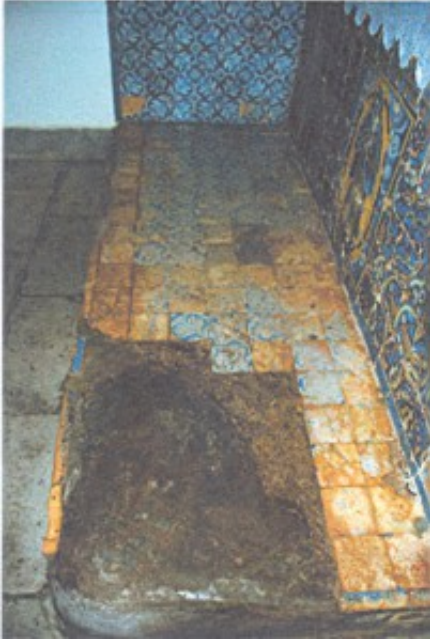
Lám. 6. Solera del frontal de altar (Foto: Autor).

Los motivos decorativos empleados en el frontal de altar, en su lateral y en la solera están tomados directamente del foco Talaverano, entre los que figuran brocados, la greca de esvásticas decorada por flores de cuatro pétalos, la cenefa de ovas y dardos vegetales, el florón escurialense y diferentes motivos geométricos y lineales en azulejos de arista.