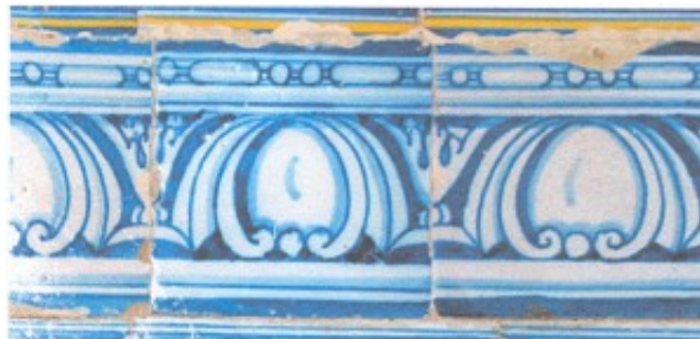
Lám. 12. Cenefa de ovas y dardos vegetales. Cenefa de roleos de vid y hojas de

Las ovas y dardos son uno de los programas decorativos más habituales en la arquitectura clásica. Gracias a las obras teóricas y a los grabadores 33 del renacimiento, se produce un proceso de recuperación de temas decorativos de época clásica que fueron extendidos en las artes decorativas del siglo XVI. La greca compuesta por ovas y dardos vegetales será empleada primero en azulejos italianos 34 y alcanzará gran profusión en las obras de azulejería talaverana y sevillana desde el último cuarto del siglo XVI, como apreciamos en la basílica de Nuestra Señora del Prado (Talavera de la Reina), en los monasterios de la Encarnación y de las Descalzas Reales (Madrid), en la iglesia parroquial de Viandar de la Vera (Cáceres), en la de Santa Teresa (Toledo) así como en el templo de San Juan Bautista en Gandul (Alcalá de Guadaíra) 35 .