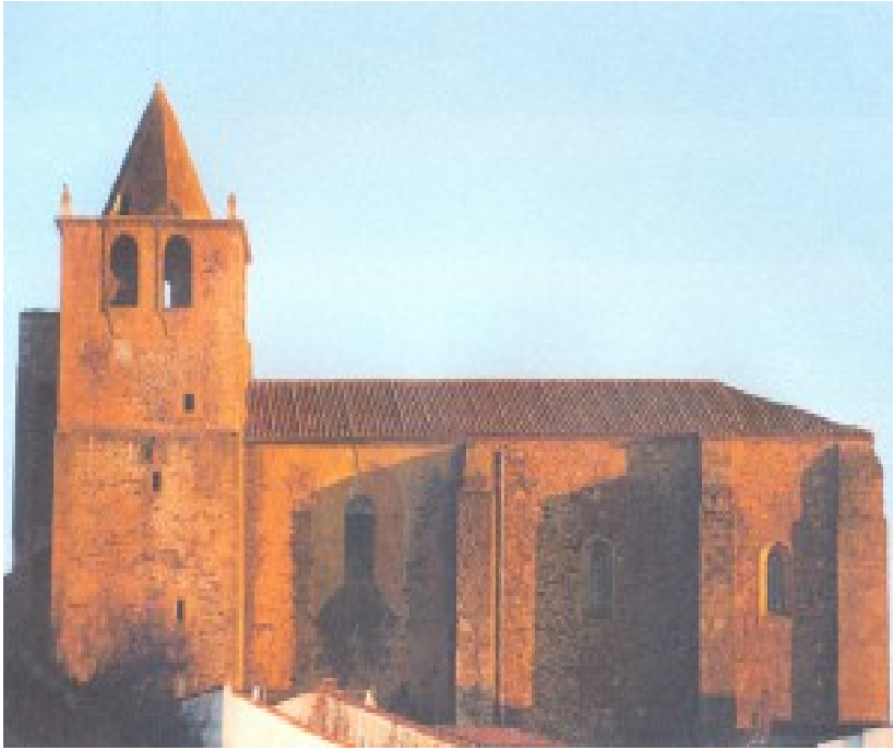
Lám. 1. Iglesia parroquial de Santiago Apóstol de Garciaz.

Tanto el aumento del volumen de población como la prosperidad económica justificaron la construcción de un templo parroquial que fue elevado sobre uno primitivo del siglo XV. Esta obra fue iniciada bajo el patrocinio del Prelado placentino Don Gutierre de Vargas Carvajal 6 , quien se encargó de contratar al maestro trujillano Sancho de Cabrera el 30 de enero de 1545 7 , siendo finalizada bajo el pontificado de Pedro Ponce de León (1560-1573) cronología ésta última fundamental para encuadrar el conjunto de azulejería analizado.