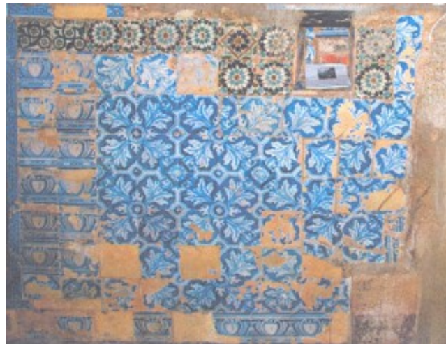
Lám. 5. Panel lateral del altar.