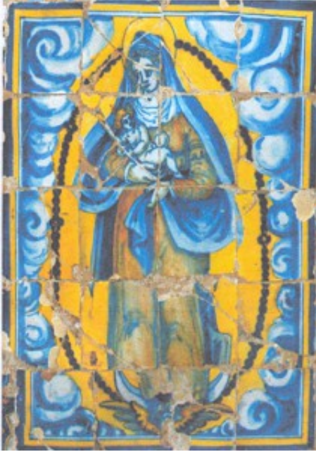
Lám. 4. Detalle del panel de la Virgen del Rosario.