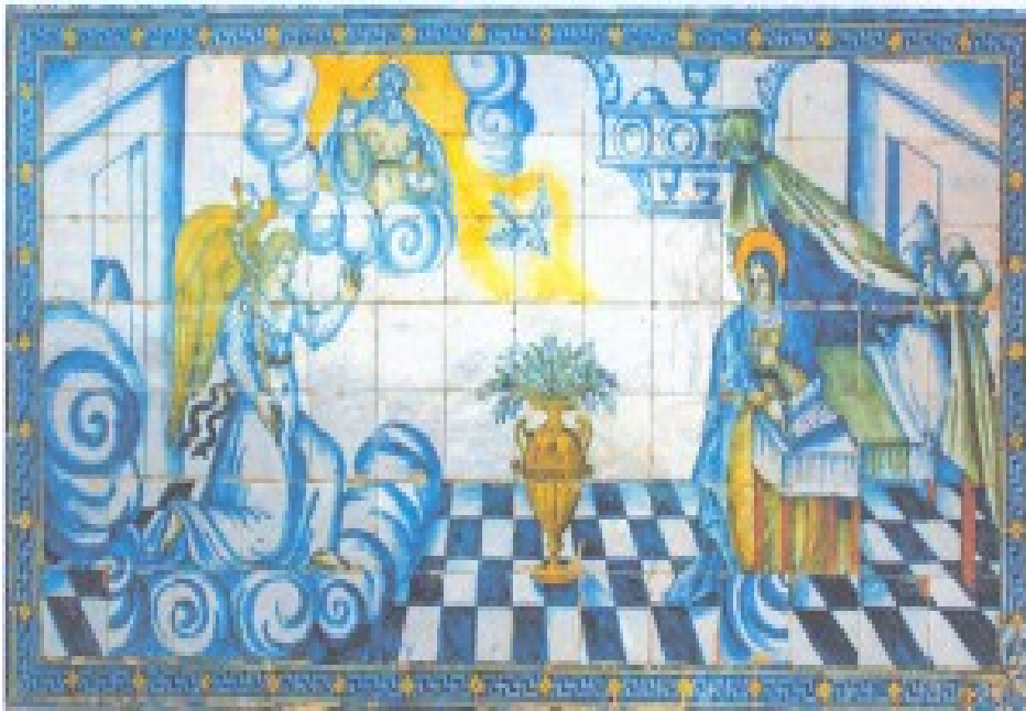
Lám. 8. Panel de la Anunciación.

arcángel Gabriel, que aún mantiene desplegadas sus alas de brillante color amarillo, descendiendo sobre unas nubes ante María para transmitirle la Buena Nueva. Gabriel es representado levantando su mano izquierda que señala al cielo, en señal de la dicha de que va a ser objeto María, ser la madre de Dios. Las palabras latinas "Ave María Gratia Plena", que forman parte de la salutación angélica, se leen en la filacteria que envuelve al cetro dorado ( calamus mensurae ), que sostiene con su mano derecha. Un jarrón con flores 19 situado en el centro de la escena hace alusión a la pureza de María, separando ambas figuras. A la derecha se encuentra la Virgen, que es sorprendida leyendo, arrodillada ante el libro de oraciones. Según San Bernardo se trata de la profecía de Isaías: La joven está en cinta y dará a luz un hijo... y que también sirve de referencia a la palabra divina. María, con un manto de intenso color azul ultramar, está arrodillada, apareciendo como modelo de piedad para el espectador, representada también como un reflejo de las prácticas devotas. Está posando ligeramente su mano izquierda sobre el pecho, mostrando su azoramiento, dirigiendo su cabeza levemente hacia el ángel, con los ojos bajos, subrayando su humildad, cualidad reforzada al encontrarse de rodillas. Bajo influencia del misticismo, María se muestra con aspecto tierno, gracioso y bello.