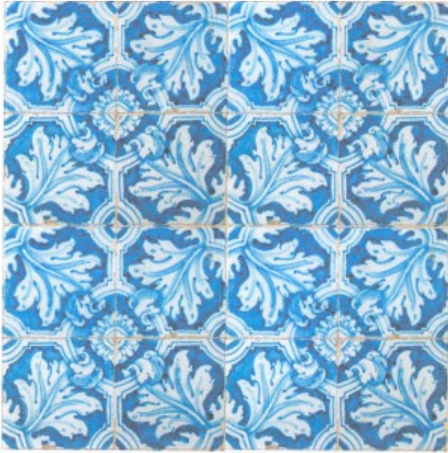
Lám. 11. Florón escurialense principal. Cenefa de ovas y dardos vegetales.

Las ovas y dardos son uno de los programas decorativos más habituales en la arquitectura clásica. Gracias a las obras teóricas y a los grabadores 33 del renacimiento, se produce un proceso de recuperación de temas decorativos de época clásica que fueron extendidos en las artes decorativas del siglo XVI. La greca compuesta por ovas y dardos vegetales será empleada primero en azulejos italianos 34 y alcanzará gran profusión en las obras de azulejería talaverana y sevillana desde el último cuarto del siglo XVI, como apreciamos en la basílica de Nuestra Señora del Prado (Talavera de la Reina), en los monasterios de la Encarnación y de las Descalzas Reales (Madrid), en la iglesia parroquial de Viandar de la Vera (Cáceres), en la de Santa Teresa (Toledo) así como en el templo de San Juan Bautista en Gandul (Alcalá de Guadaíra) 35 .