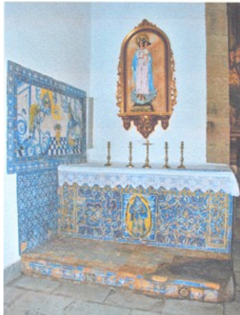
Lám. 2. Vista general del altar de la Virgen del Rosario.

El altar de la Virgen del Rosario se encuentra ubicado junto a la capilla mayor, en el lado del Evangelio, junto al presbiterio de la iglesia de Santiago Apóstol. El frontal de altar presenta las siguientes dimensiones: 1,30 m de altura; 1,38 m de ancho y 2,60 m de longitud.