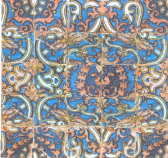
Lám. 9. Restitución gráfica del brocado. Greca de esvásticas decorada por flores de cuatro pétalos

Imitaciones de brocados semejantes a los de Garciaz los encontramos en las iglesias parroquiales de Garrovillas (Cáceres), San Andrés (Talavera de la Reina), Viandar de la Vera y Valverde de la Vera (Cáceres) 27 .